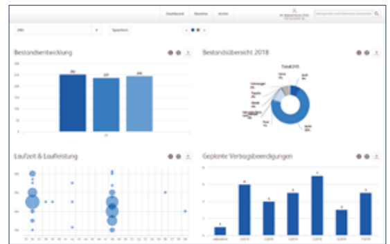
Übersichtsdashboard: Alle wichtigen Informationen auf einen Blick.

Wichtige Kennzahlen wie zum Beispiel Daten zur Bestandsübersicht, die Verteilung der Laufzeit/Laufleistung oder zukünftige Vertragsbeendigungen werden in einem Dashboard übersichtlich und optisch ansprechend dargestellt.